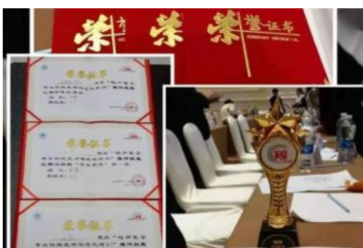
规培医生国家级比赛获一等奖