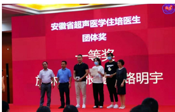
规培医生参加省级比赛获一等奖