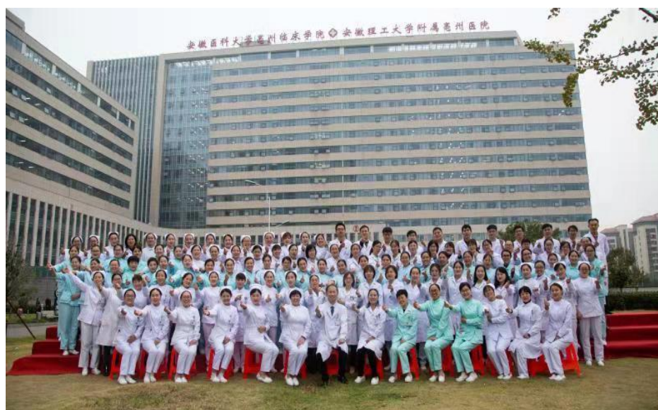
我们强大团结的团队

科室目前拥有员工 155 人，其中主任医师 2 人，副主任医师 20 人，主治医师 24 人。师资力量雄厚，拥有住培带教师资 19 人，其中省级以上住培师资 14 人。