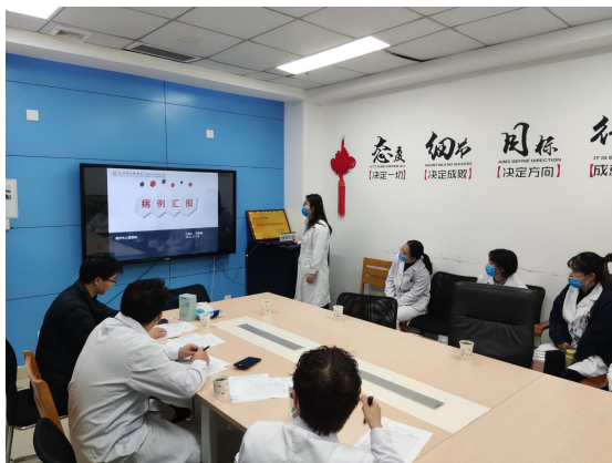
住培生病例汇报会