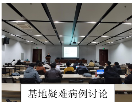
基地疑难病例讨论