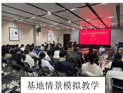
基地情景模拟教学